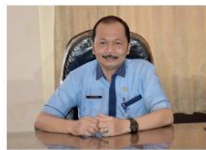
TUGIRAN, Amd, Kep. Kepala Sub Bagian Perencanaan & Anggaran